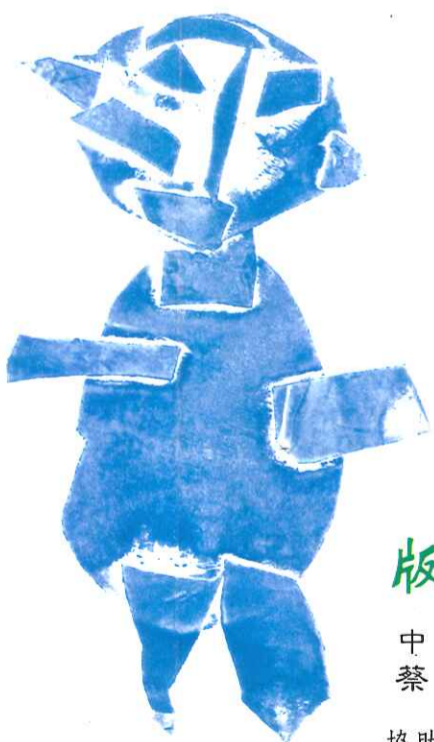
版畫 中二乙 蔡秉融