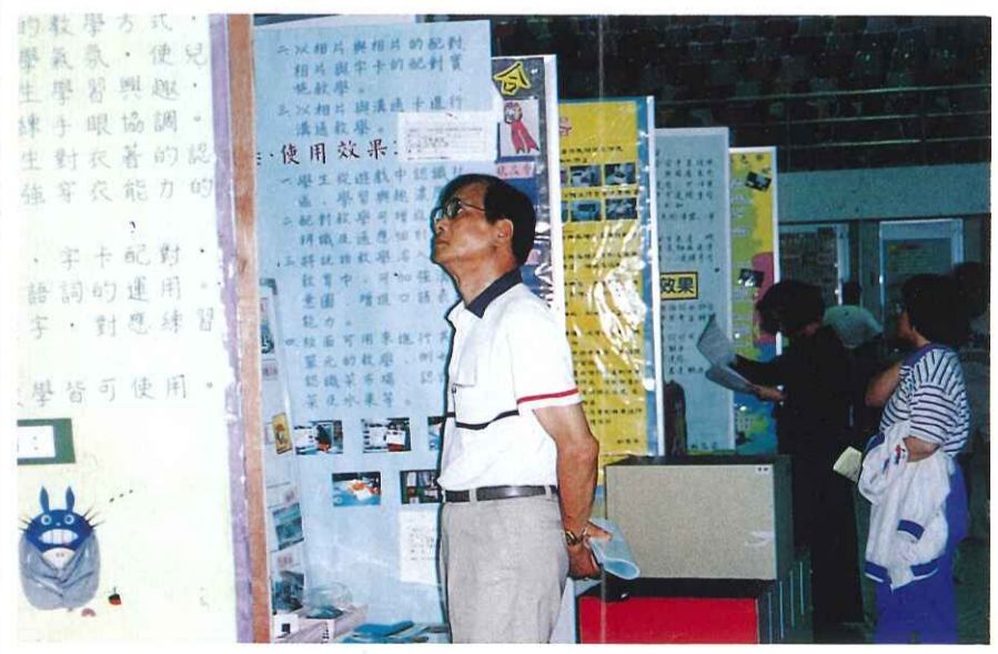
◎本校承辦台灣省84學年度身心障礙教育教材教具展覽，報名的作品計有288件、實際參展的計有264件，得獎件數：特優有8件、優等26件、佳作43件、合計77件，並由教育廳副廳長王宮田先生於5月15日主持剪綵儀式後展開全省巡迴展覽(5月15日至6月20日)供大眾參觀，參觀者眾、佳評如潮。